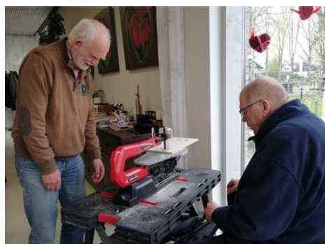
Hartjes zagen, wie de wie de wagen.