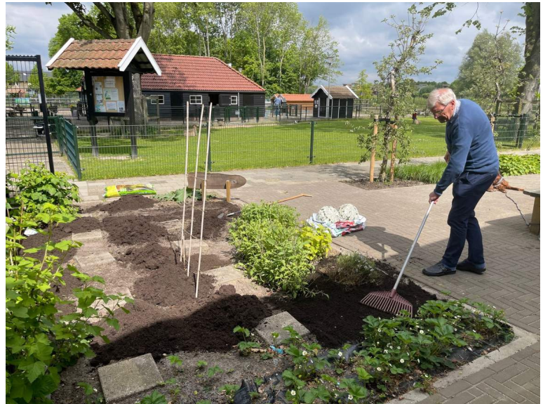
De 1e framboos